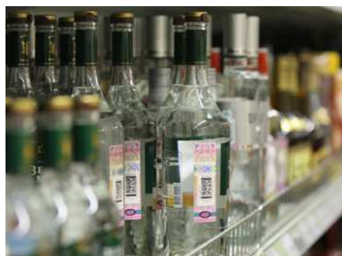
Среднестатистический россиянин выпивает в год 20 литров крепких алкогольных напитков

В 2011 году фальшивого элитного алкоголя было реализовано 30% от общего числа легального. В 2010 эта цифра составляла почти 50%. Несмотря на снижение подделок на рынке, эксперты уверены, что пиратское производство водки или виски не прекратится, так как в России на нелегальные напитки всегда будет спрос.